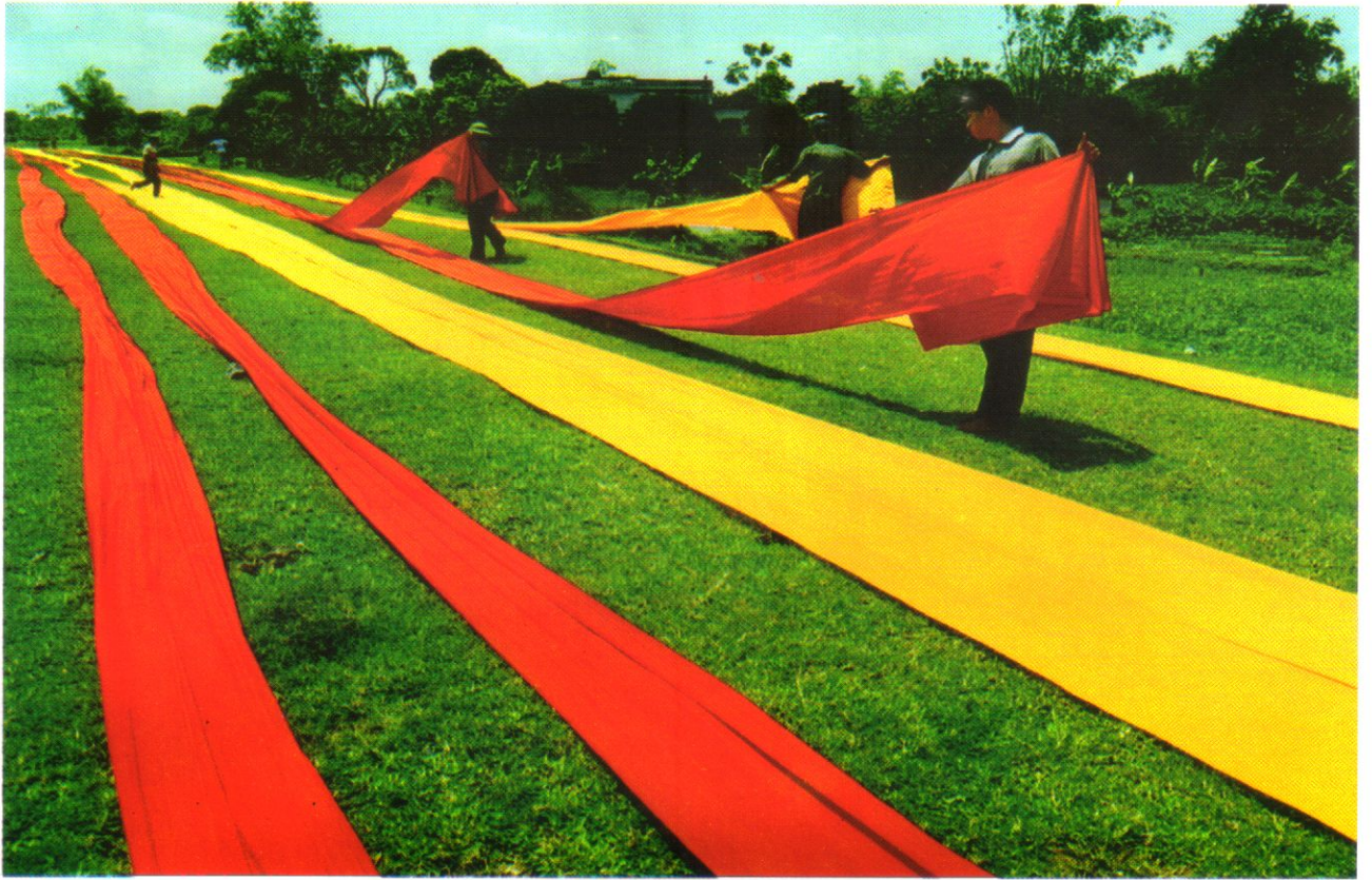
Dệt lụa - nghề truyền thống của Hà Nam.