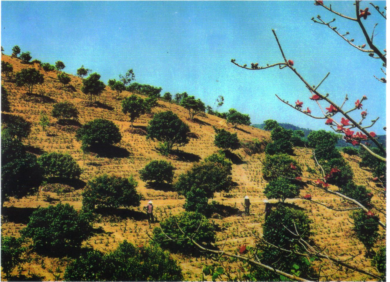
Mô hình kinh tế đồi rừng của xã Ba Sao huyện Kim Bảng.