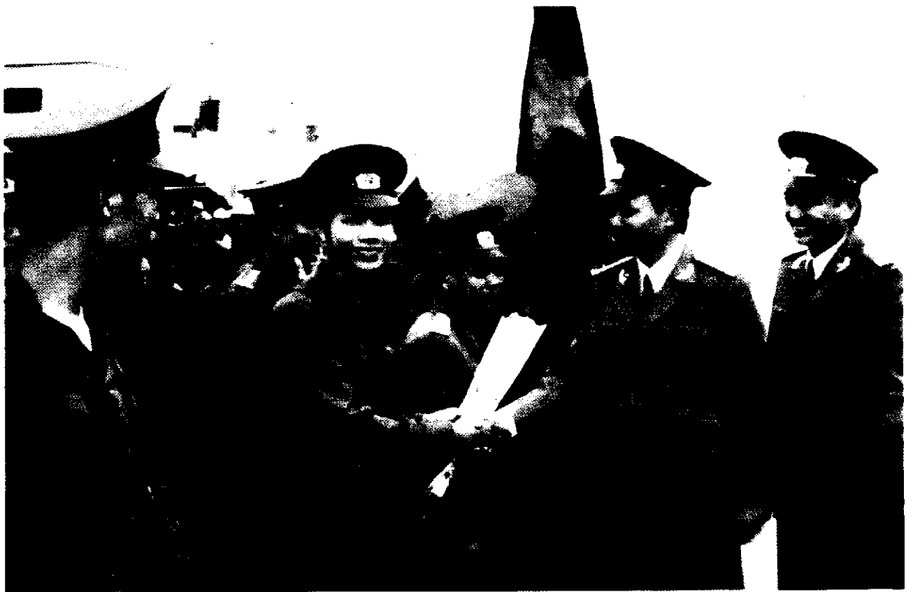
Thế hệ trẻ Hà Nam lên đường xây dựng và bảo vệ Tổ quốc.