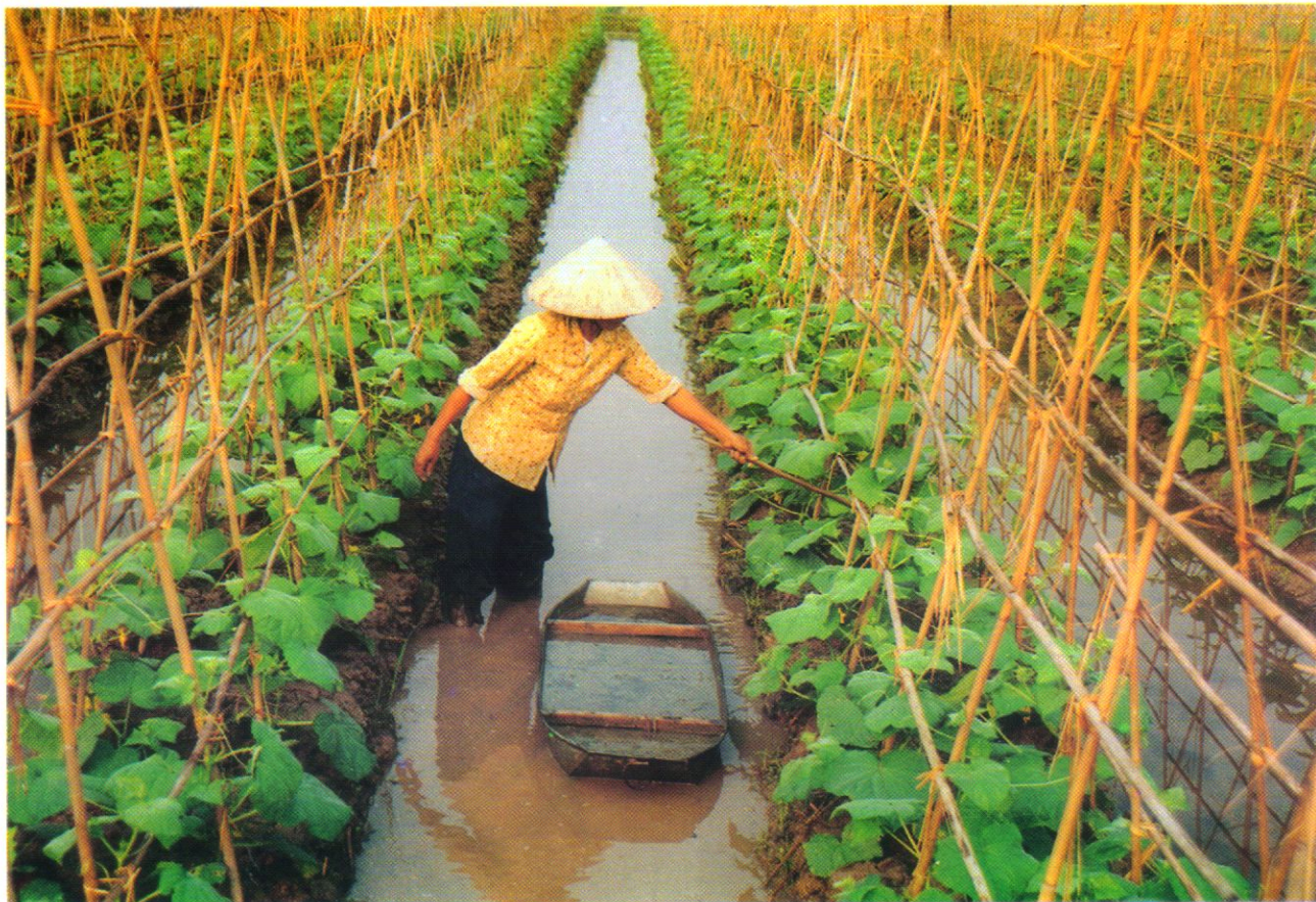
Dưa chuột xuất khẩu ở xã Yên Bắc (Duy Tiên) - Kết quả của chuyển đổi cơ cấu giống cây trồng.