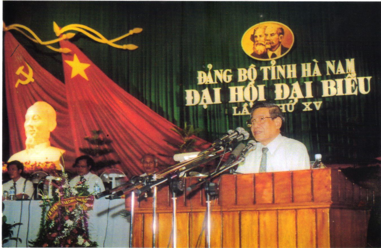
Đồng chí Lê Khả Phiêu, Tổng Bí thư BCH Trung ương Đảng Cộng sản Việt Nam phát biểu tại Đại hội Đảng bộ tỉnh lần thứ XV (2-7-1998).