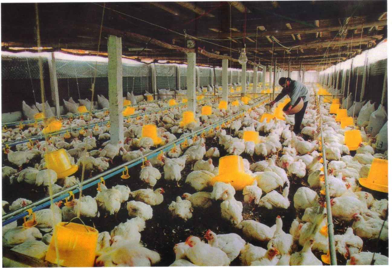
Chăn nuôi gà theo phương pháp công nghiệp ở xã Kim Bình huyện Kim Bảng.